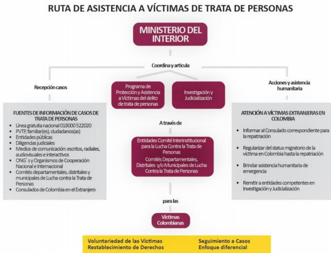
Tabla No. 1